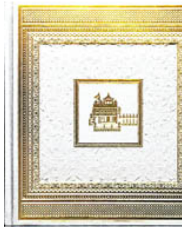
The cover of 'The Golden Temple of Amritsar, Reflections of the Past (1808-1959)'

A labour of love has gone into the creation of a massive new book about the Golden Temple that incorporates a comprehensive account of the photographic and visual history of the holy place, including the earliest known image from an 1825 miniature.