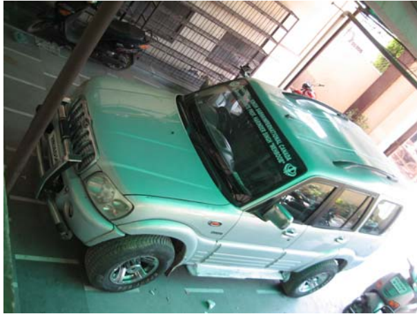
An overview of the vehicle